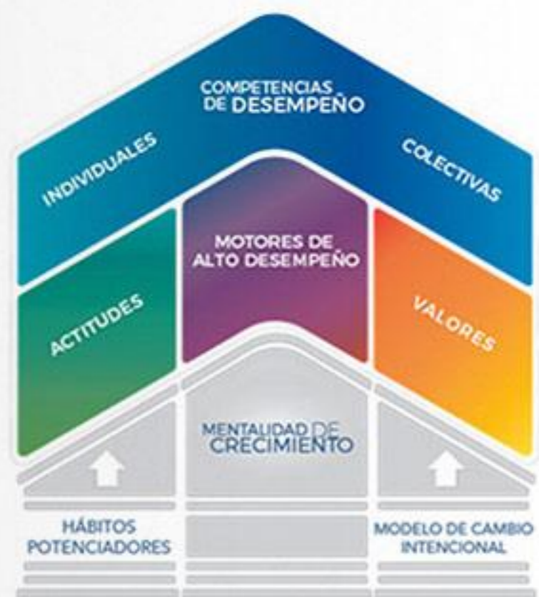
Modelo Top Performance Professional