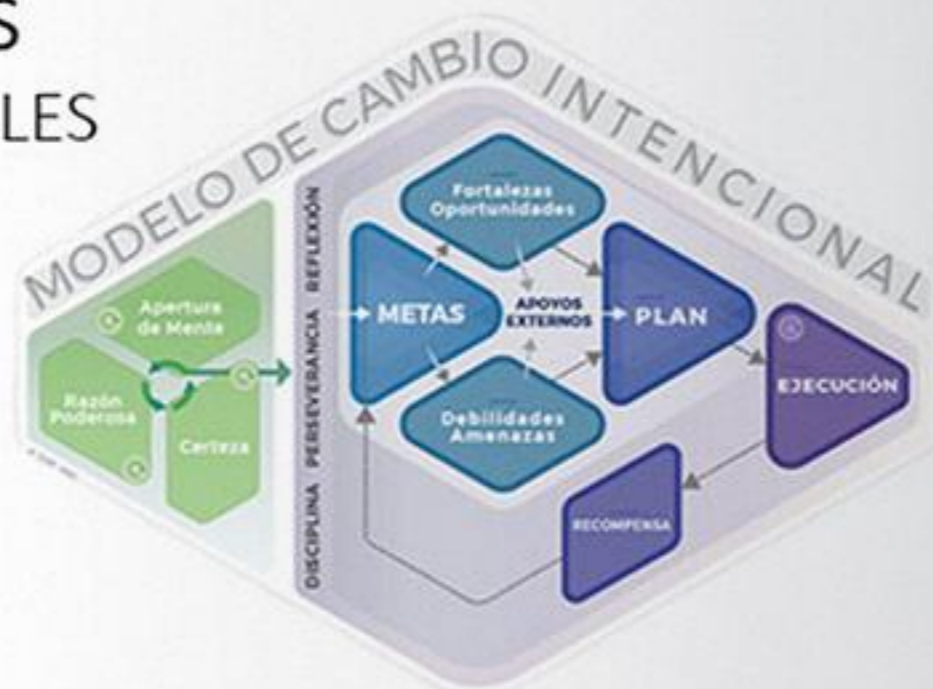
Modelo de Cambio Intencional