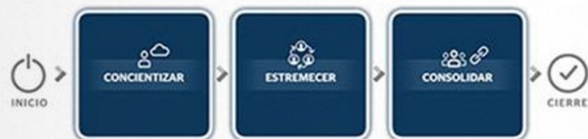
MODELO HÍBRIDO EXPERIENCIAL EMOCIONAL